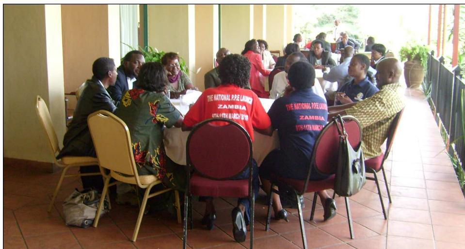
Discussions en groupe pendant l'atelier EFP à Lusaka, mars 2010.

L'atelier de Lusaka a réuni des représentants d'organisations professionnelles de plusieurs disciplines : médecins, infirmières, pharmaciens, physiothérapeutes et dentistes, ainsi que d'autres parties prenantes du secteur national de la santé et des professionnels des médias. Ce groupe multidisciplinaire a œuvré dans le souci de remédier à l'état déplorable des contextes de travail, de la sécurité des professionnels de la santé et de leur bien-être. Les carences du système de santé de la Zambie ont été identifiées : taux élevés d'attrition et d'émigration, surcharges de travail, salaires trop bas, sécurité compromise, répartition inégale du personnel soignant.