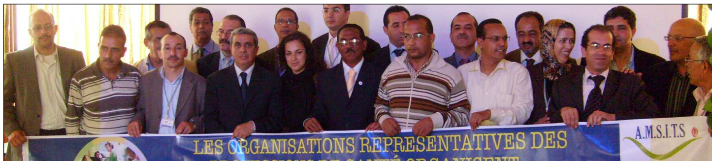
Participants au premier atelier EFP à Rabat, mai 2010.

L'atelier marocain s'est tenu à Rabat du 5 au 7 mai 2010. Se sont réunis à cette occasion des représentants des plusieurs disciplines de santé (médecins, gynécologues, dentistes, pharmaciens, infirmières), d'institutions de formation du personnel de santé, de l'OMS, ainsi que d'autres intervenants du secteur de la santé, originaires de tout le pays.