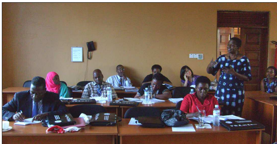
Échange d'expériences pendant l'atelier de Kampala, mars 2010.

Un groupe multidisciplinaire composé de membres de cinq professions de santé (médecins, infirmières, dentistes, pharmaciens et physiothérapeutes) et d'autres parties prenantes du secteur de la santé s'est réuni à Kampala en mars dernier. Les participants ont pris l'engagement de collaborer à la mise en œuvre de la campagne EFP en Ouganda. La réunion faisait suite à un atelier pilote organisé en 2008 lors du Forum international sur les ressources humaines pour la santé (Alliance mondiale pour les personnels de santé), au cours duquel le matériel de la campagne EFP a été testé.